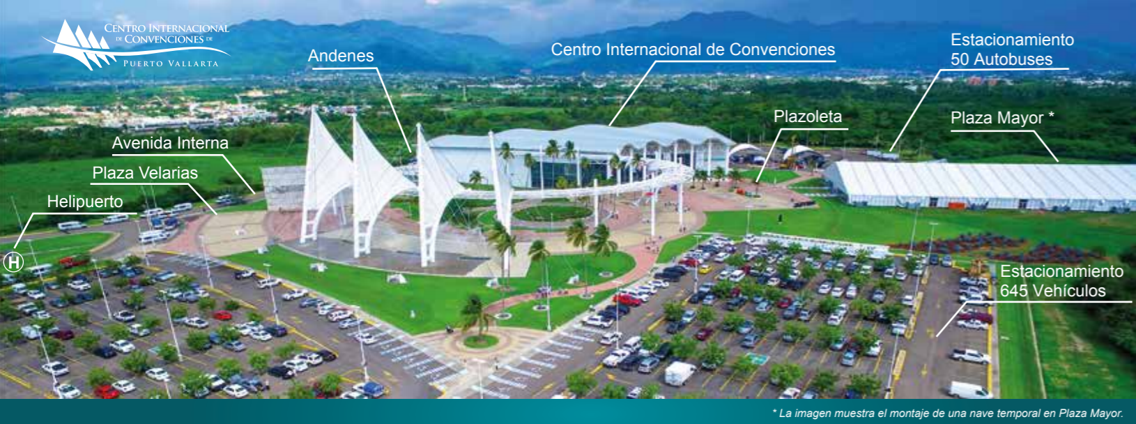
* La imagen muestra el montaje de una nave temporal en Plaza Mayor.